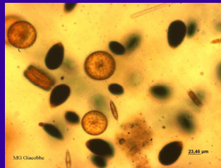
Foto di Ostreopsis ovata in microscopia ottica, durante un bloom fitoplanctonico osservato nelle acque costiere dello Ionio (davanti a Siracusa)