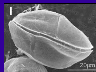
Foto al microscopio elettronico a scansione di Ostreopsis ovata in visione laterale; esemplare raccolto nel Tirreno (Clone CNR)

Eventi dannosi riconducibili a fioriture di Ostreopsis spp, riportati in Italia per la prima volta lungo le coste toscane nel 1998, sono stati registrati ad oggi in molte altre località costiere della penisola durante l'estate. L'impatto sull'ecosistema durante le fioriture di Ostreopsis è grave: si manifestano alterazioni della qualità e del colore dell'acqua, ipo e/o anossia dei fondi e ancora più seriamente morie di invertebrati bentonici come molluschi, celenterati ed echinodermi. In particolare in Liguria ed in Puglia sono stati segnalati fenomeni allarmanti per la salute umana con ospedalizzazioni per affezioni respiratorie, congiuntiviti e dermatiti. Questa sintomatologia è stata associata alla presenza nell'aerosol e nell'acqua di tossine prodotte da O. ovata (analisi compiute su campioni naturali di aggregati macrofitici ricoperti da Ostreopsis ). Le analisi delle tossine nei campioni di plancton e acqua, durante le recenti fioriture, hanno rivelato la presenza di un composto a struttura palitossino-simile .