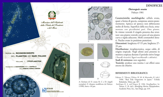
Criteri di identificazione di Ostreopsis ovata , descritti da M. Abbate nella guida al riconoscimento del plancton nei mari italiani

La frequenza di questi eventi indica una preoccupante tendenza all'aumento negli ultimi due-tre anni e diventa fondamentale l'individuazione di aree e periodi dell'anno a più alto rischio, allo scopo di prevedere e mitigare gli effetti negativi delle fioriture e mettere in atto contromisure adeguate per proteggere la salute umana e l'ambiente costiero marino