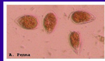
Foto di Ostreopsis ovata al microscopio ottico (campione raccolto nelle acque costiere della Liguria)

Eventi dannosi riconducibili a fioriture di Ostreopsis spp, riportati in Italia per la prima volta lungo le coste toscane nel 1998, sono stati registrati ad oggi in molte altre località costiere della penisola durante l'estate. L'impatto sull'ecosistema durante le fioriture di Ostreopsis è grave: si manifestano alterazioni della qualità e del colore dell'acqua, ipo e/o anossia dei fondi e ancora più seriamente morie di invertebrati bentonici come molluschi, celenterati ed echinodermi. In particolare in Liguria ed in Puglia sono stati segnalati fenomeni allarmanti per la salute umana con ospedalizzazioni per affezioni respiratorie, congiuntiviti e dermatiti. Questa sintomatologia è stata associata alla presenza nell'aerosol e nell'acqua di tossine prodotte da O. ovata (analisi compiute su campioni naturali di aggregati macrofitici ricoperti da Ostreopsis ). Le analisi delle tossine nei campioni di plancton e acqua, durante le recenti fioriture, hanno rivelato la presenza di un composto a struttura palitossino-simile .