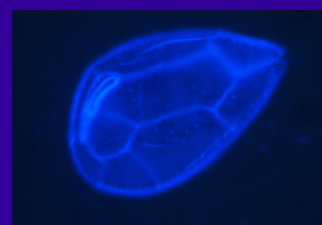
Ostreopsis cf siamensis , colorata con calcofluor e fotografata all'invertoscopia in epifluorescenza (coltura OSTR B4, Laguna di Ganzirri, Sicilia)

La frequenza di questi eventi indica una preoccupante tendenza all'aumento negli ultimi due-tre anni e diventa fondamentale l'individuazione di aree e periodi dell'anno a più alto rischio, allo scopo di prevedere e mitigare gli effetti negativi delle fioriture e mettere in atto contromisure adeguate per proteggere la salute umana e l'ambiente costiero marino